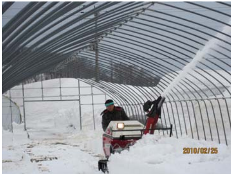
2月中旬から育苗ハウスの除雪を開始