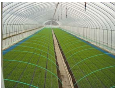
5月11日の育苗ハウス