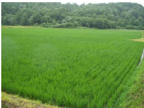
順調に稲が育っています（7月12日）

今年は5月に寒い日が続いたため心配していましたが、6月以降は好天に恵まれ稲も順調に育っています。このまま天気が続いて笑顔で出来秋を迎えられたら嬉しいと思います。今年は「ななつぼし」のほかに「おぼろづき」も作付けしました。今年のお米は期待できますよ～（笑）