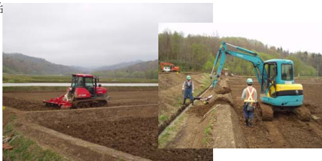
今年新たに取得した圃場の手直し（水田は約24haになりました）