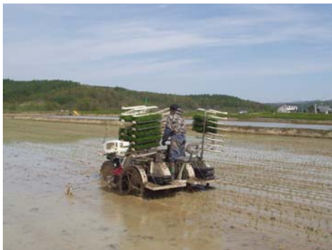
5月23日 田植えを開始⇒終了は5月31日